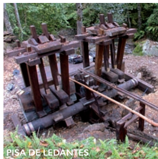
PISA DE LEDANTES

The process of recovering this hydraulic device, now almost unique in Cantabria.