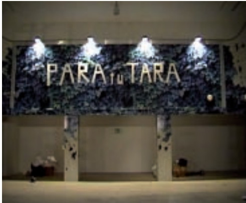
JUAN LÓPEZ PARA TU TARA . 2006. VÍDEO, 5', ED.: 4/5 + P.A.

LA ACTUALIDAD. Los nuevos medios tecnológicos, electrónicos o digitales, mejorados día a día, continúan siendo incorporados por los artistas como útiles de trabajo con los que adaptarse a las nuevas necesidades. El formato, aunque supone una parte esencial de la obra y