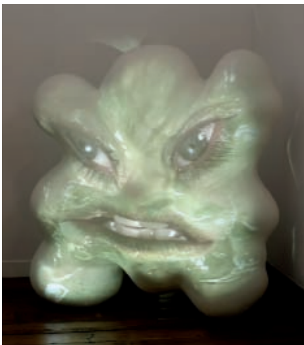
TONY OURSLER. GLOB . 2004. FIBRA DE VIDRIO, PROYECTOR Y REPRODUCTOR DE DVD. 117 X 117 X 68 CM.

Por último, cabe destacar la calidad de las obras de dos jóvenes artistas que recientemente se han incorporado a la Colección Norte de Arte Contemporáneo: la obra de