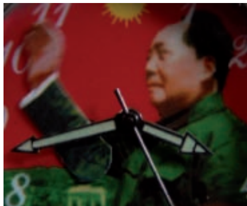
LILIANA PORTER. FOX IN THE MIRROR . 2007. BETACAM TRANSFERIDO A DVD, 6'20'', ED.: 6/8.

en el dique seco creativo sin más valor que el puramente formal.