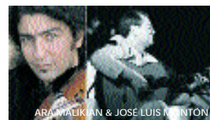
ARA MALIKIAN & JOSÉ LUIS MONTÓN

Dirección: c/ Bonifaz, 6. Santander. Tel. 942 319 310