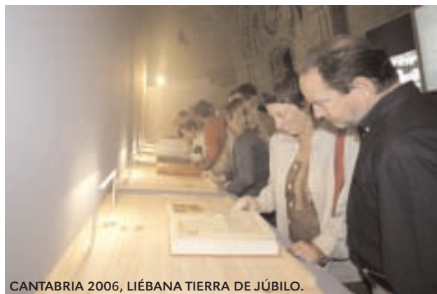
CANTABRIA 2006, LIÉBANA TIERRA DE JÚBILO.