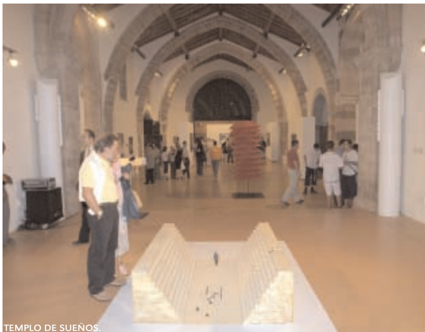
TEMPLO DE SUEÑOS.