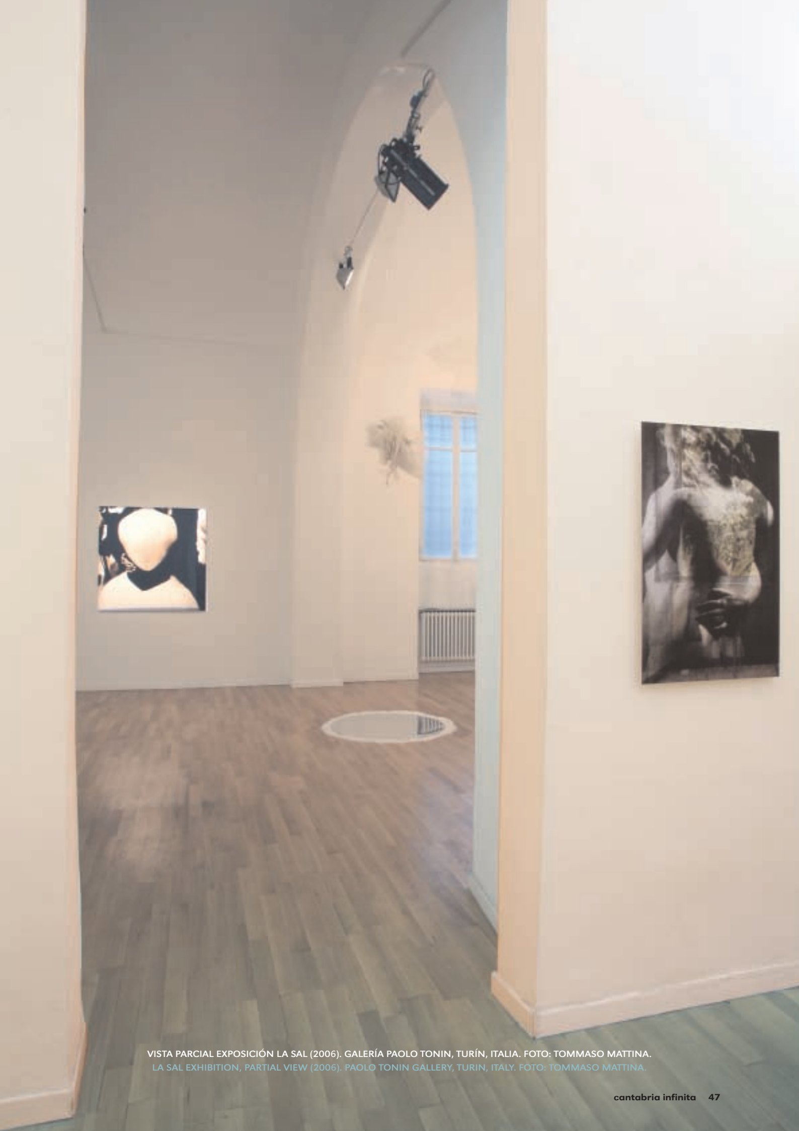
VISTA PARCIAL EXPOSICIÓN LA SAL (2006). GALERÍA PAOLO TONIN, TURÍN, ITALIA. FOTO: TOMMASO MATTINA. LA SAL EXHIBITION, PARTIAL VIEW (2006). PAOLO TONIN GALLERY, TURIN, ITALY. FOTO: TOMMASO MATTINA.