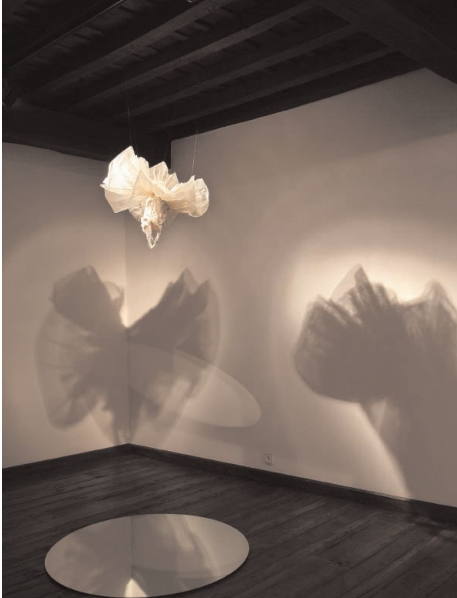
INSTALACIÓN PAVANA, 2004. TUTU, ESPEJO DE 120 CM Ø, VERSIÓN JAZZ DE "PAVANA PARA UNA INFANTA..." DE HORACIO ICASTO TRIO. FOTO: NAVAJA SUIZA. PAVANA INSTALLATION, 2004. TUTU, MIRROR WITH A 120 CM Ø, JAZZ VERSION OF "PAVANA PARA UNA INFANTA..." BY HORACIO ICASTO TRIO. FOTO: NAVAJA SUIZA.