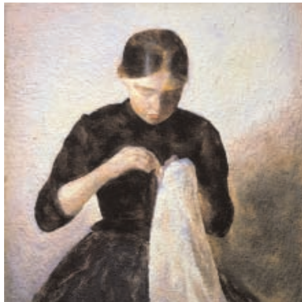
VIK MUNIZ. YOUNG GIRL SEWING, AFTER WILHEM HAMMERSHOI (2006). 229 X 183 CM.

concern and, although Spanish products have not yet attained the high value levels of foreign markets, it all seems to indicate that, in our land, a new type of private collecting is arising that conceives an investment in art as a safe venture. The impulse in the art market is not only the task of museum, art centres, foundations and private collections; it has now passed from the hands of collectors to individual consumers. As Damien Hirst once stated: "Art is about life, the art market is about money" and Arco is, after all, a sophisticated money-making machine. ■